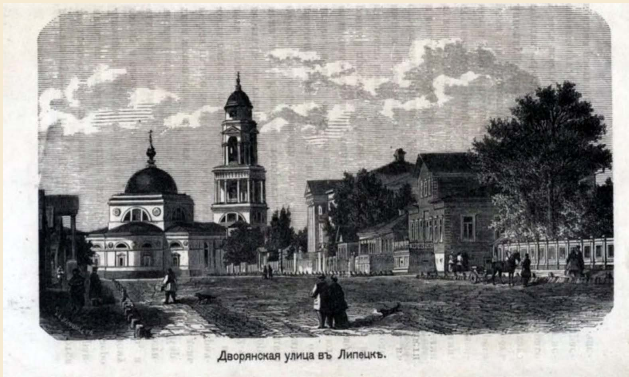
Дворянская улица въ Липецкъ.

Какой секрет хранит эта старинная фотография нашего города?